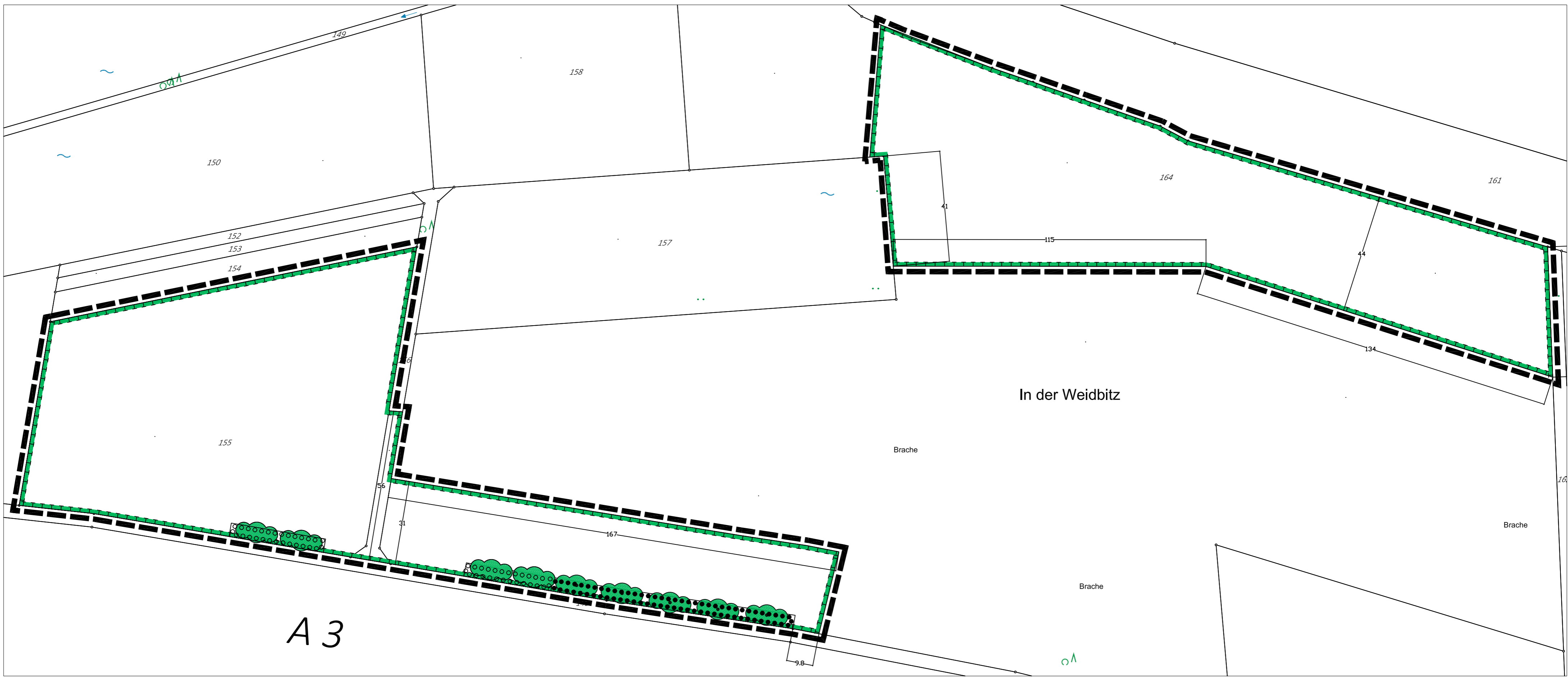
Ausgleichsfläche, Gemarkung Großholbach, Flur 2, Flurstück 155, 156 tlw. und 164 tlw. - 17.255m 2 + 13.745m 2