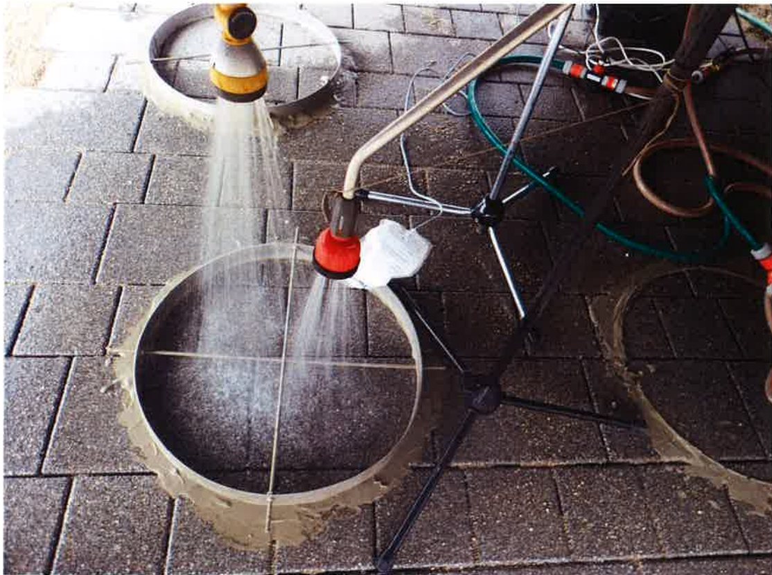
Bild: CityTruck 10 cm, Verlegung 36/24 mit 18/18, Prüfungsdurchführung