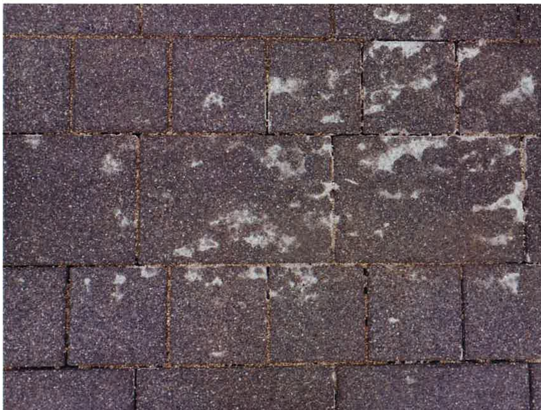
Bild: CityTruck 10 cm, Verlegung 36/24 mit 18/18, Verlegebild