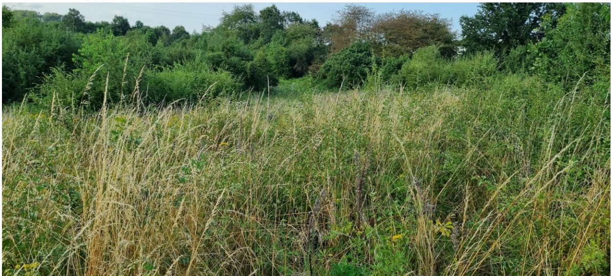
Foto 4: Verbuschte Grünlandbrache mittlerer Standorte im östlichen Randbereich des Untersuchungsraumes

Gewässerlebensräume sind aufgrund fehlender Gewässer im geplanten Erweiterungsbereich nicht vorhanden.