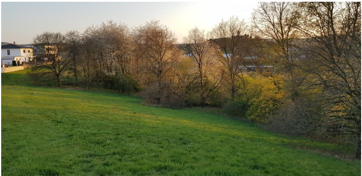
Foto 3: Übergangsbereich zwischen dem Parkplatz und der angrenzenden Wohnbebauung durch Grünland und Gehölzsaum

Die Biotoptypenausstattung des Untersuchungsraumes wird im Umweltbericht zum Bebauungsplan genauer beschrieben und ist im Bestands-/Konfliktplan (Anlage zum Umweltbericht) dargestellt.