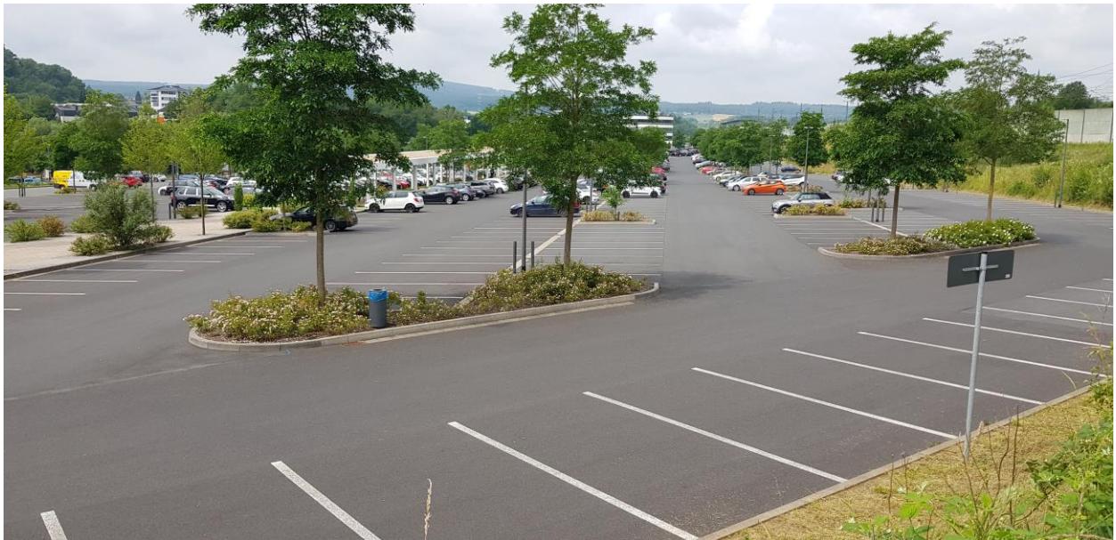
Foto 1: Parkplatz des FOC mit einzelnen Laubbäumen und Pflanzbeeten