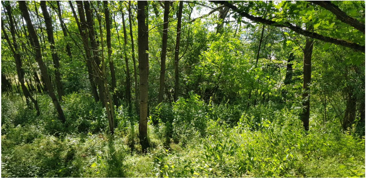
Foto 2: Gehölzbestand zwischen Parkplatz und östlich angrenzender Wohnbebauung